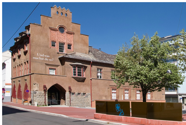
afo, Foto: Bernhard Waldmann